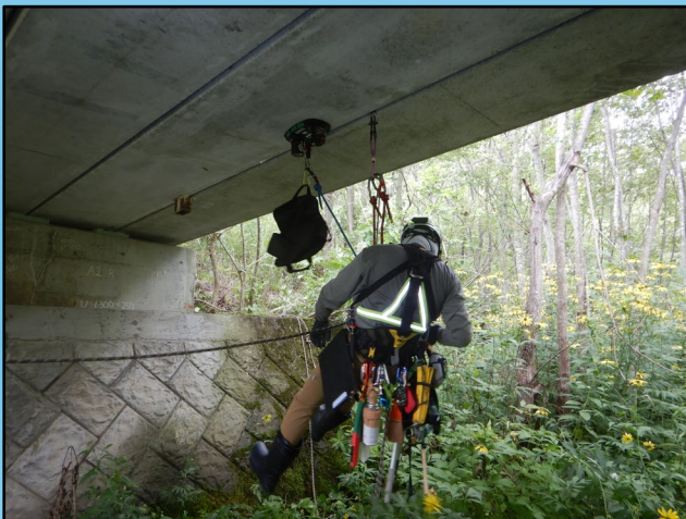
橋梁点検(ロープアクセス) (R7年 普通林道パンケ線ほか橋梁点検委託業務)