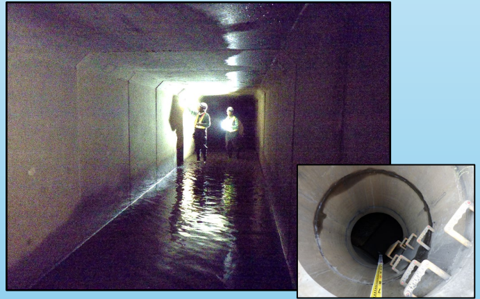
R7年 雨水管路施設特別重点調査業務