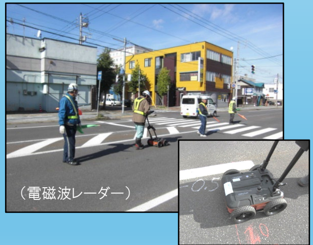
路面下空洞化調査 (R5年 士別道路事務所管内 士別市外 道路事業資料作成業務)